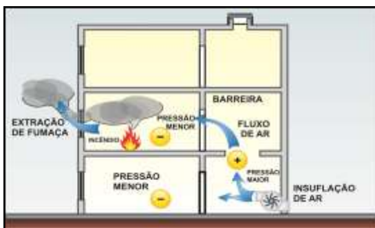
Figura 3 – Diferencial de Pressão

4.1.3 O controle de fumaça é obtido pela introdução de ar limpo e pela extração de fumaça, pelos seguintes tipos de sistemas, conforme Tabela 1.