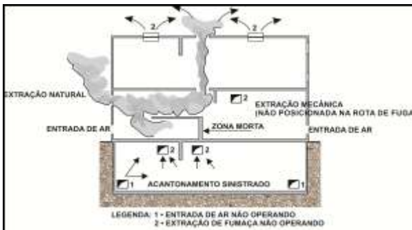
Figura 2 – Zonas mortas